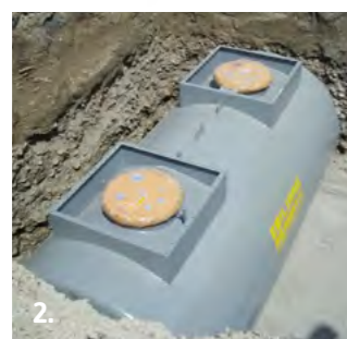
2. Posizionamento nello scavo su apposita base. Placement into a firm foundation.