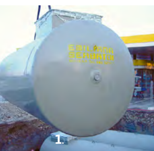
1. Movimentazione aerea. Aerial handling.

Designed and manufactured in compliance with European Standard UNI EN 12285-1